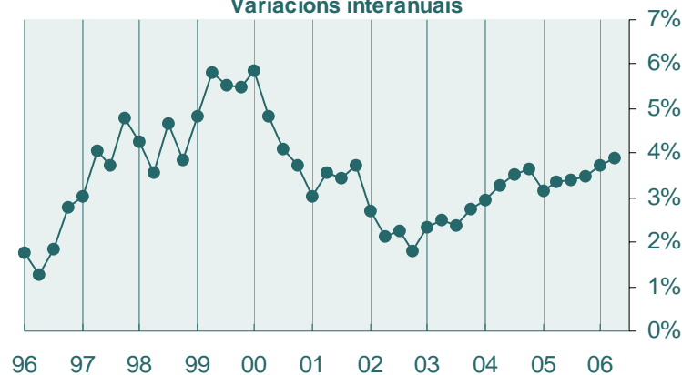
PIB pm. Volume encadeado referencia 2000. Datos corrixidos de estacionalidade e calendario. Variacións interanuais

A demanda interna contribúe con 3,6 puntos ao crecemento do PIB, oito décimas menos que no trimestre anterior, a achega da demanda externa neta é de 0,3 puntos porcentuais, un punto superior á do primeiro trimestre.